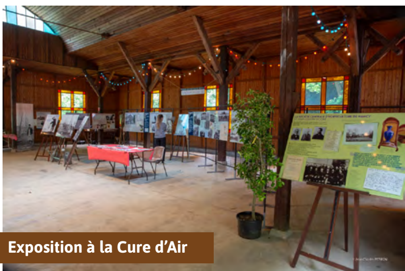
Exposition à la Cure d'Air

Sur la base des informations qui ont été recueillies, le nombre de total de visiteurs peut être estimé à 2500 à 3000 personnes en six ans.