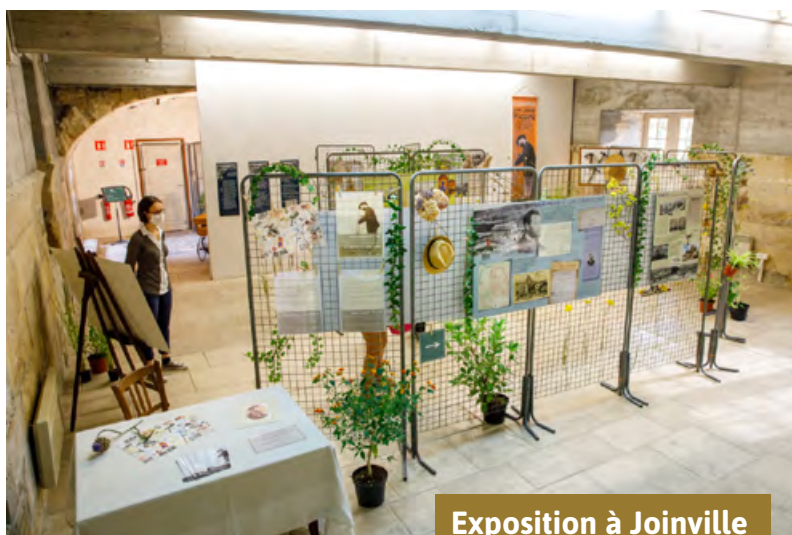
Exposition à Joinville

La plupart des visiteurs ont témoigné de leur curiosité, de leur intérêt et de leur satisfaction d'avoir pu visiter l'exposition ; nombre d'entre eux ont souligné la qualité des documents présentés.