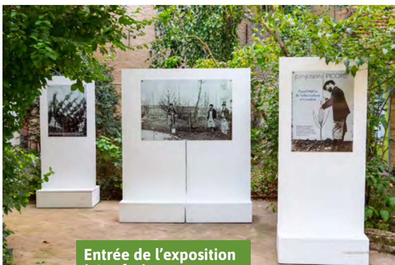
Entrée de l'exposition à Lanfroicourt