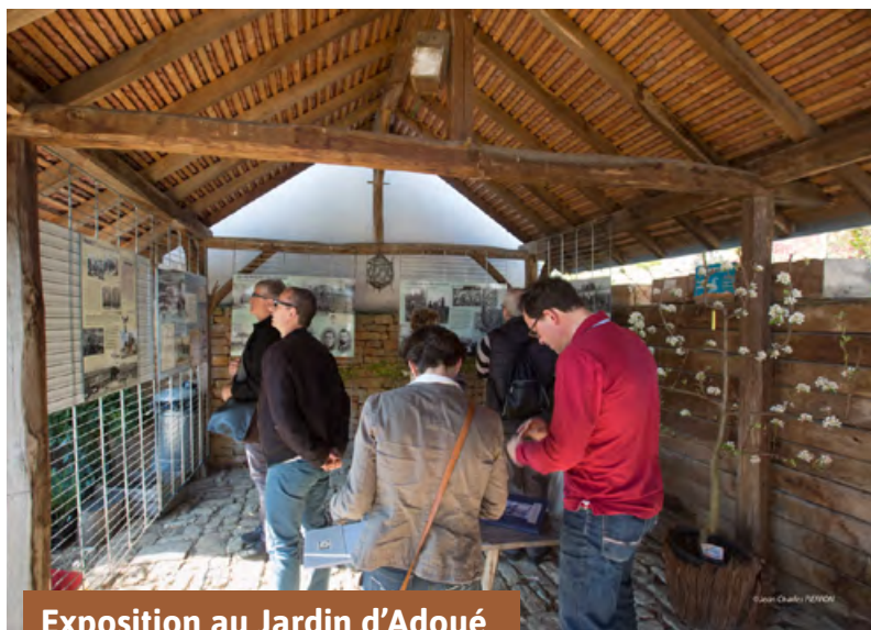
Exposition au Jardin d'Adoué